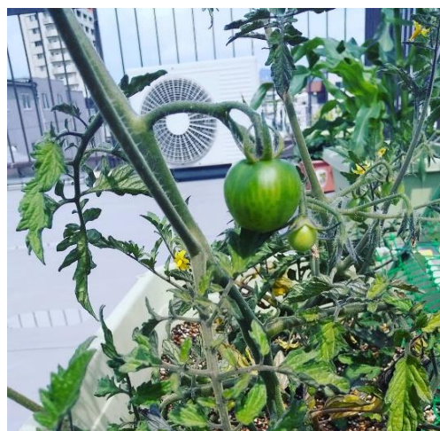
(子ども達が選んだトマトの苗)

えています。が、事業所の屋上でおやつを食べたり、家庭菜園を育てたりしながら屋外での気分転換を楽しんでいます。今年度の家庭菜園は子ども達から育てたい野菜をアンケートで募り、苗の買い出しからプランターの土作りまで子ども達も参加しながら行いました。野菜の看板やカラス除けグッズも手作りしたんですよ。野菜が実る前から収穫を楽しみにしている子ども達です。また、屋上ではシャボン玉や、大縄跳びにもチャレンジしています。外出が難しい中でも子ども達楽しく遊ぶことができるように活動を考え、工夫して過ごしていこうと思います。