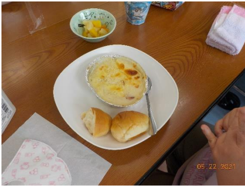
(出来上がったグラタン)

話し合いを重ねる中で出てきた意見には、「調理実習がしたい」、「おやつ作りがしたい」、「自分達の作ったゲームで1階フロアの利用者さんと交流したい」など様々な要望ができました。出合った意見を基に5月22日には、感染対策や手指の消毒を徹底して調理実習に取り組みました。協力しながら作ったグラタンはとても美味しかったです。これからもみんなで見守りを出し合い、決定ができる事を大切にしながら活動を続けたいと思っています。