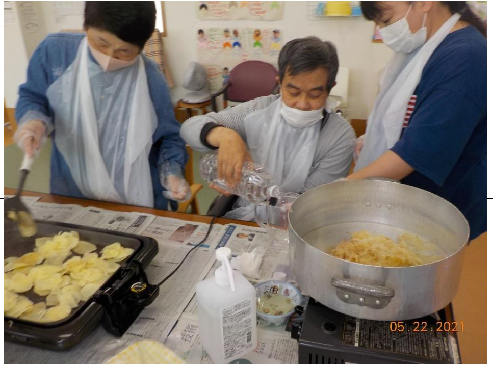
(グラタン作りの様子)